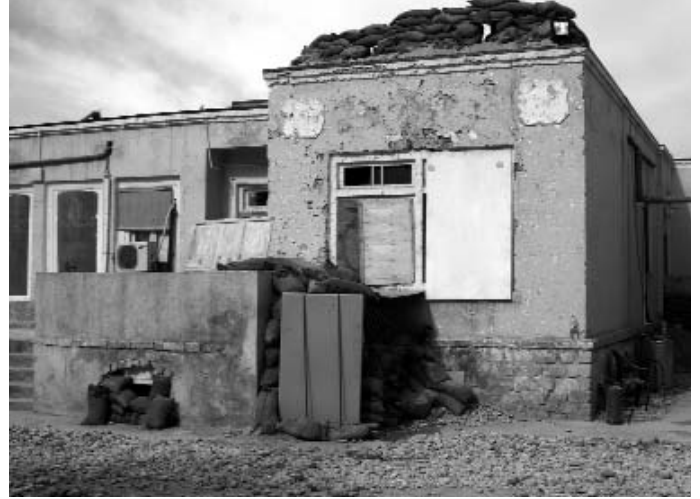
BESKUTT: Bygningene der de norske ISAF-soldatene søkte ly under beskytning i Maimana, Afghanistan, før og etter angrepet.