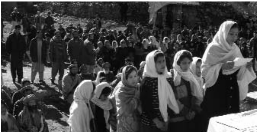
"ASANA-SKOLEN": Man kan stille mange spørsmål om utdanningssystemet i Afghanistan. Parviz Zakaria skal forsøke å finne svar. Bilde: Jenter taler under åpningen av skolen AiN bygget med støtte fra Åsne Seierstad.