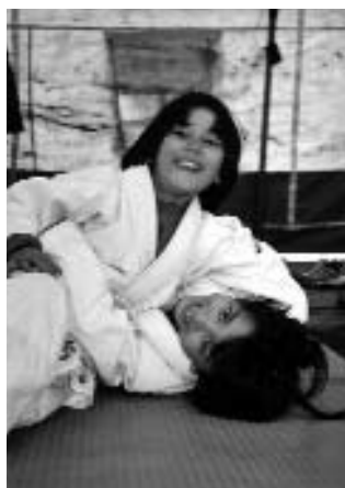
Judo for fred satser på at alle norske judoklubber skal bidra økonomisk til Aschianasentrene i Kabul.

5. mars arrangerte Judo for Fred et seminar angående sine aktiviteter og situasjonen i Afghanistan på Toppidrettssenteret ved Sognsvann. Bakgrunnen for seminaret var å gi nok ferdigheter til spesielt til judoutøvere som skal på en utvekslingsreise til Afghanistan.