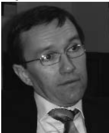
LANGT FREM: Espen Barth Eide mener noen kan få det verre før de kan få det bedre i Afghanistan.