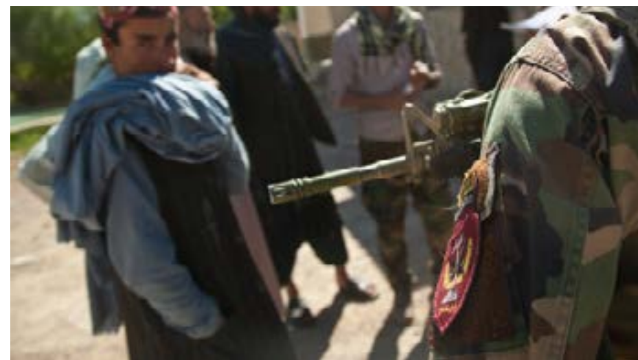
Afghanske soldater i Helmand, 2013.

Hvilken som helst av disse nødvendige prosessene har potensial til å kullkaste den skjøre og ustabile maktbalansen mellom etniske grupper, krigsherrer, politikere og narkotikamafiaer i Afghanistan. Det mest avgjørende er valget, som etter forrige valg i 2009 å dømme, lett kan bli manipulert av President Hamid Karzai på vegne