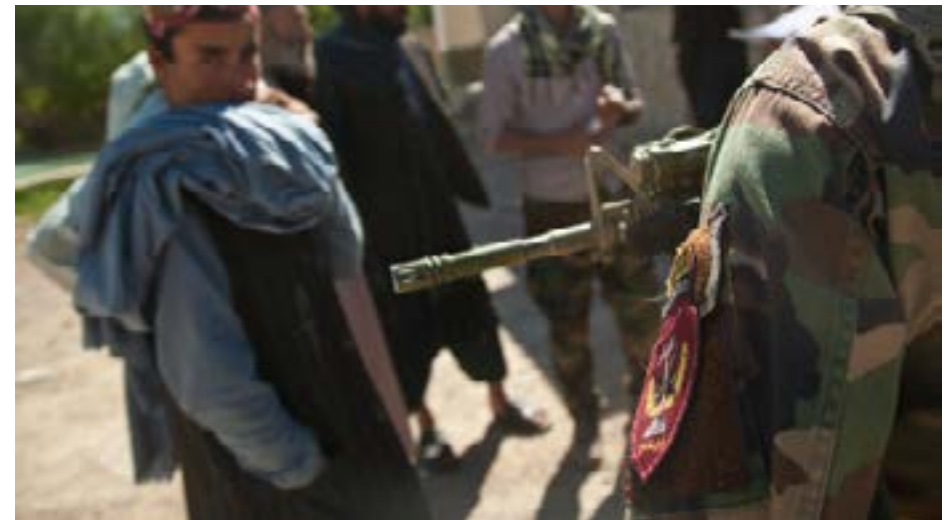
Afghanske soldater i Helmand, 2013.

Hvilken som helst av disse nødvendige prosessene har potensial til å kullkaste den skjøre og ustabile maktbalansen mellom etniske grupper, krigsherrer, politikere og narkotikamafiaer i Afghanistan. Det mest avgjørende er valget, som etter forrige valg i 2009 å dømme, lett kan bli manipulert av President Hamid Karzai på vegne