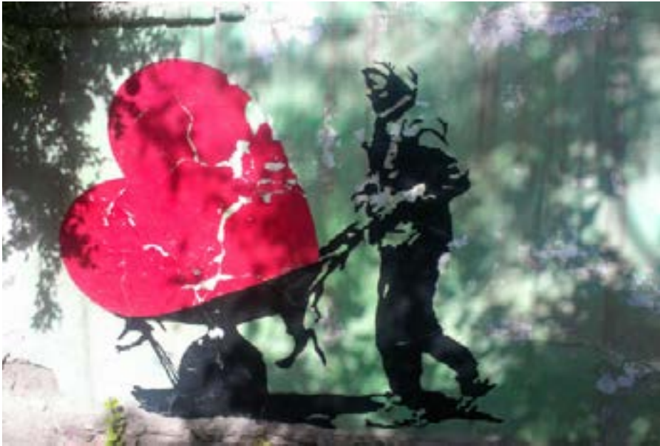
Grafitti av Kabir Mokamel

go-talet som held fram med å betale lønningar til sine kjernetroppar og truar, som Minister Ismael Khan, med å ta til våpen igjen om «mujahedin» tape sin politiske innflytelse. Uroa over kva som vert utviklinga framover har ført til ein etnisk konsentrasjon i Kabul. Folk flytte for å søkje tryggleik hjå si eige etniske/religiøse gruppe eller stamme. Det store fleirtalet av desse ønskje ikkje konflikt, men dei er usikre på dei politiske leiarane sine.