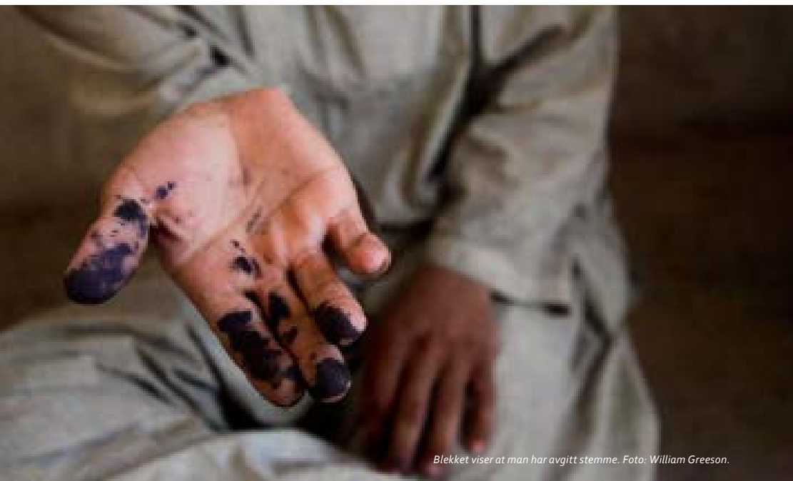
Blekket viser at man har avgitt stemme.