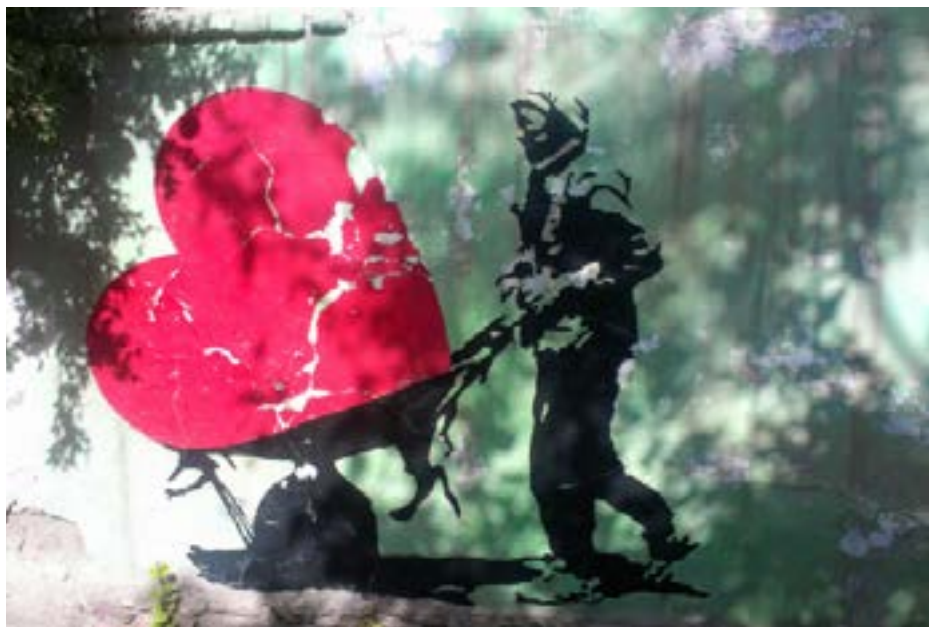
Grafitti av Kabir Mokamel

go-talet som held fram med å betale lønningar til sine kjernetroppar og truar, som Minister Ismael Khan, med å ta til våpen igjen om «mujahedin» tape sin politiske innflytelse. Uroa over kva som vert utviklinga framover har ført til ein etnisk konsentrasjon i Kabul. Folk flytte for å søkje tryggleik hjå si eige etniske/religiøse gruppe eller stamme. Det store fleirtalet av desse ønskje ikkje konflikt, men dei er usikre på dei politiske leiarane sine.