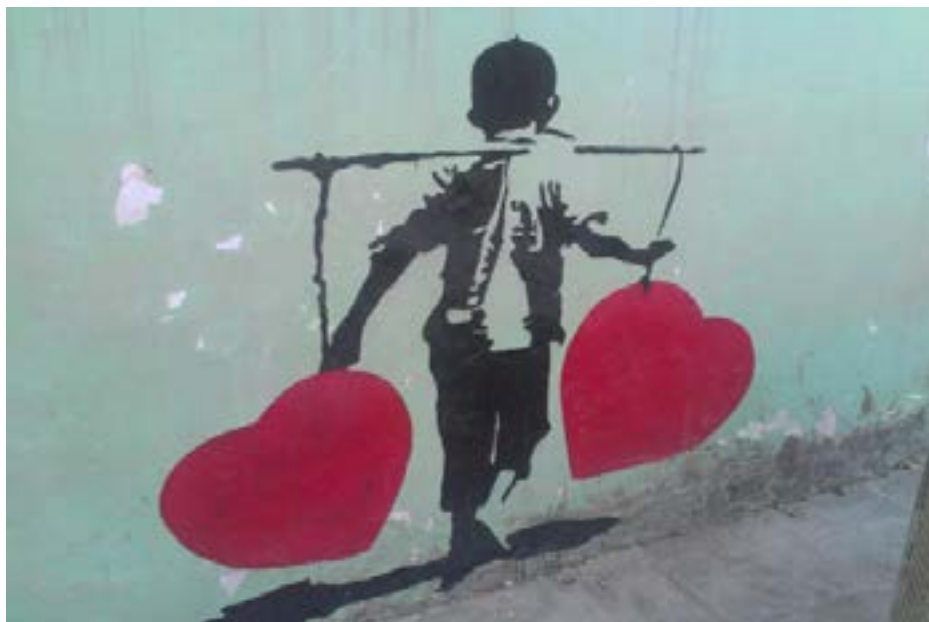
Graffiti av Kabir Mokamel

Videre har afghanske kvinneverettighetsforkjempere ofte operert i spenningen mellom tilgang til utenlandske midler og støtte, og de konservatives skepsis rettet mot dem grunnet nettopp dette. Mange hevder også at den betydningsfulle finansielle støtten som er gitt til kvinneorganisasjoner det siste tiåret, har tatt fokuset vekk fra politisk mobilisering på grasrotnivå.