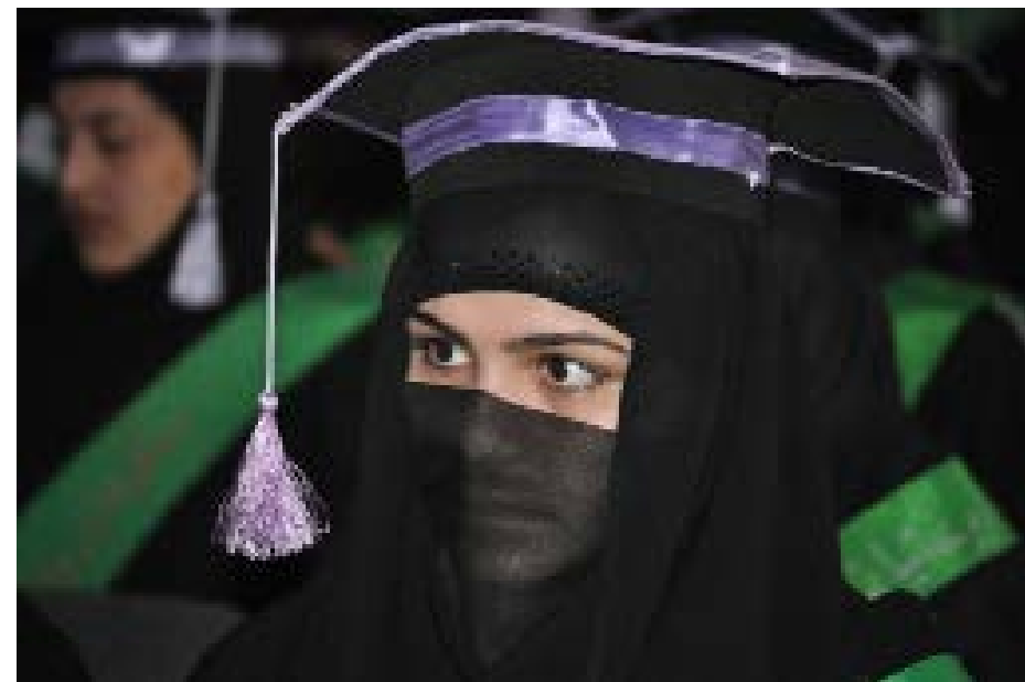
Ferdigutdannet jordmor i Jalalabad, januar 2014.