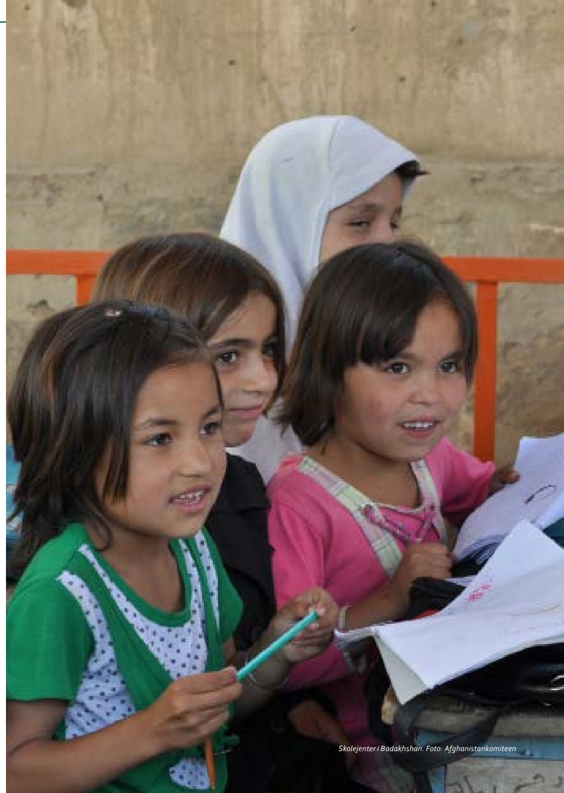
Skolejenter i Badakhshan.

Antall studenter i videregående utdanning har også økt betraktelig. På slutten av Taliban-perioden i 2001 var det totalt 4.000 mannlige studenter, men ingen kvinner. Dette tallet har økt til 250.000 studenter, hvorav 45.000 (18 prosent) er kvinner. Antall videreutdanningsinstitusjoner har økt