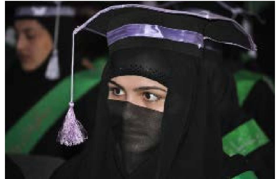
Ferdigutdannet jordmor i Jalalabad, januar 2014.