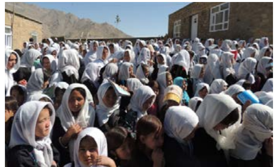
Skolejenter i Ghazni.