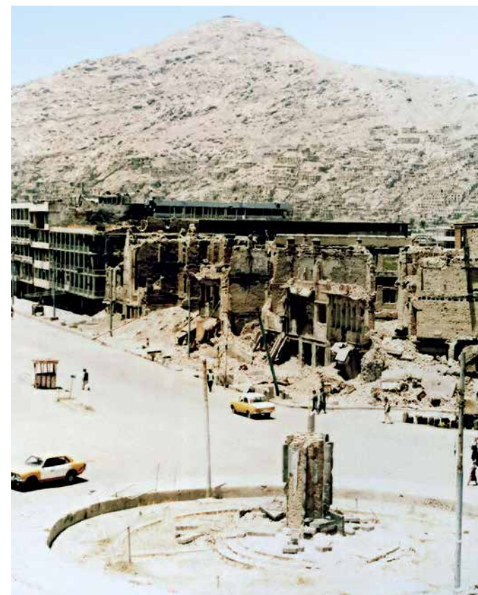
Kabul i 1992.