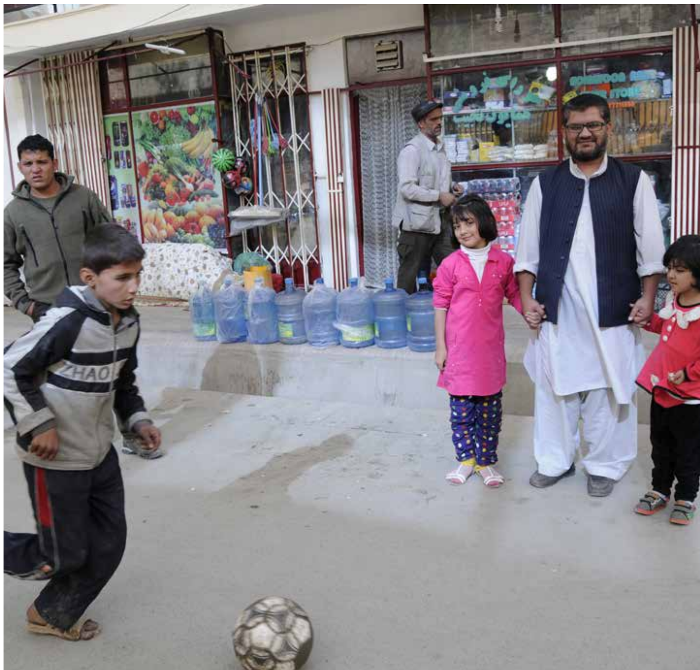
Gatebilde fra Kabul 2014.