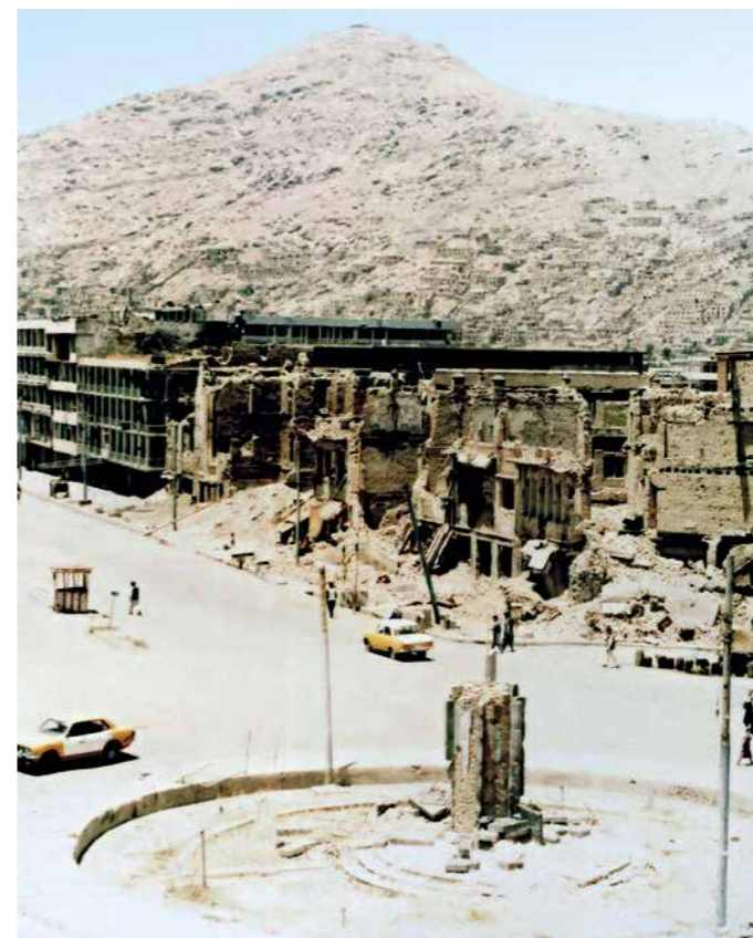
Kabul i 1992.