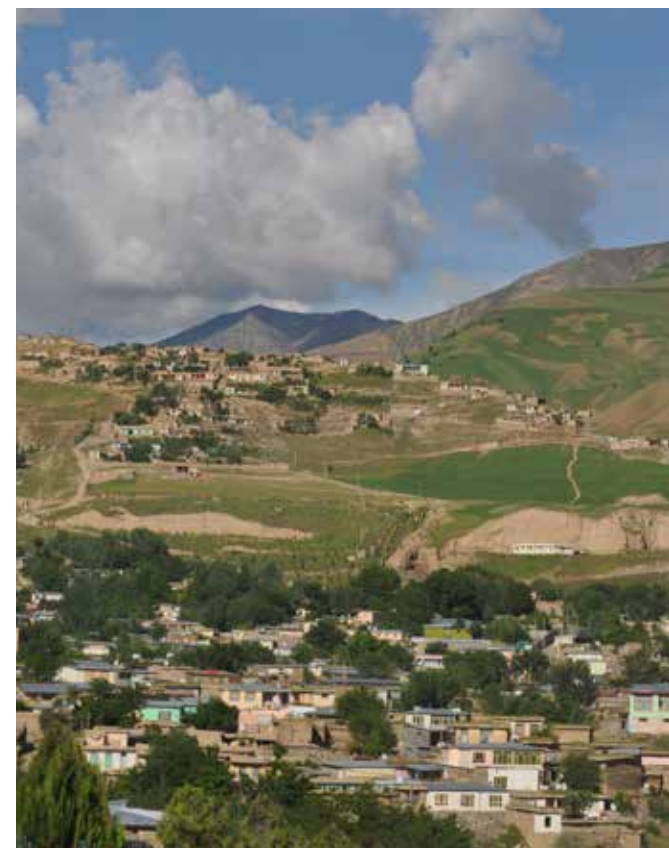
Faizabad, provinshovedstaden i Badakhshan.

Hun forventer store forandringer i utdanningssystemet, slik at også talentfulle fattige studenter får sjansen til å fortsette utdanningsløpet i sin egen provins.