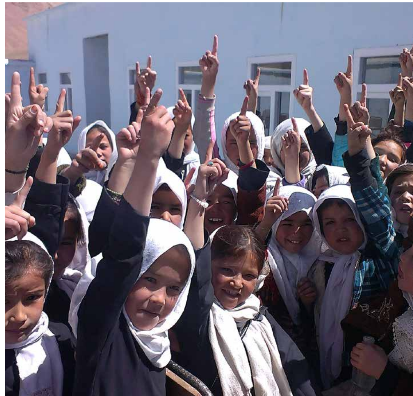
Skolejenter i Ghazni, 2014.

I en sårbar stat som Afghanistan er det svært bekymringsfullt når frustrasjon går over i sinne. Da bør alle følge nøye med. Hvor ble det av håpet om et nytt Afghanistan?