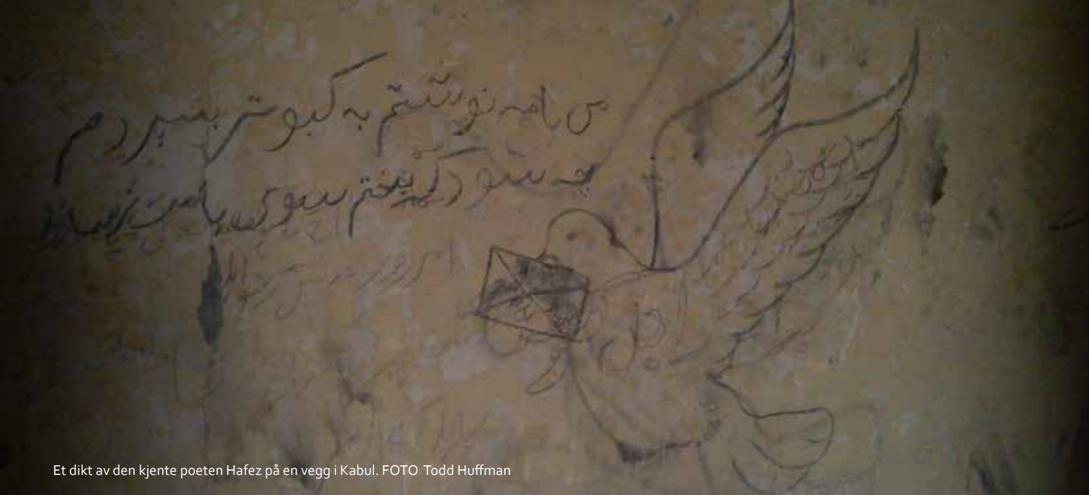
Et dikt av den kjente poeten Hafez på en vegg i Kabul.

For mange kvinner kommer burkaen først på lista over hva de trenger for å ivareta egen sikkerhet. “Med burka føler jeg meg trygg, jeg blir anonym og ingen trakasserer meg”, fortalte nylig en jordmor fra Nangarhar. Det neste på lista er trygg transport som gir muligheten til å unngå uønsket fysisk kontakt med fremmede menn. Ved å være anonym i det offentlige rom får de større bevegelsesfrihet og utsetter seg for mindre fare.