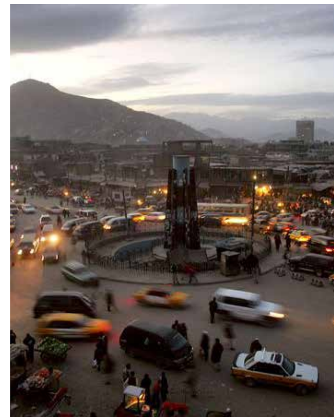
Kabul i 2012.

har vært fundamentet for stabilitet i Afghanistan. Selvråderett og lokalt selvstyre har alltid stått sterkt og afghanerne er kjent for å ikke la seg styre av utenforstående. Den nye statsdannelsen favnet ikke landet i sin helhet, og man kom i en situasjon der statens leveranser ikke stod i forhold til forventningene. Det til tross for at enorme summer ble overført til Afghanistan. Kritiske røster hevder at pengene som skulle redusere